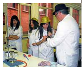
Un momento de la jornada.

Teatro, actividades deportivas, guerra de relatos, debates... El colegio Espíritu Santo tiró la casa por la ventana para celebrar un cuarto de siglo dedicado a la educación de sus alumnos. En la jornada de puertas abiertas del pasado lunes, padres y estudiantes participaron en las actividades que el centro organizó para su aniversario. Una ocasión perfecta para presentar la revista digital que llevan preparando a lo largo del curso y que puede leerse a través de la página web www.colegioespiritusanto.com . → www.elmundo.es/aula